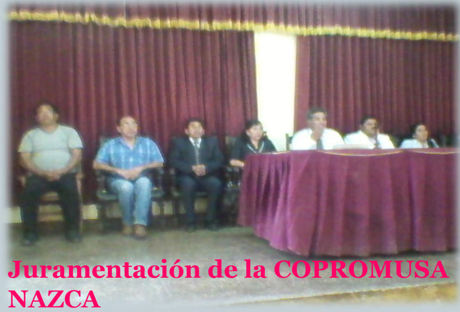
Juramentación de la COPROMUSA NAZCA