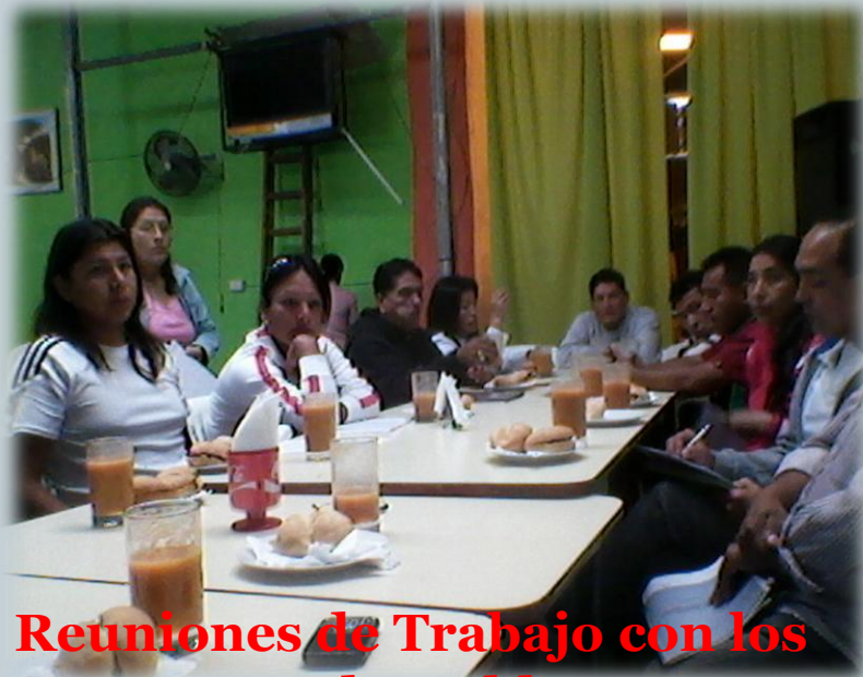
Reuniones de Trabajo con los Personas vulnerables y personas viviendo con VIH