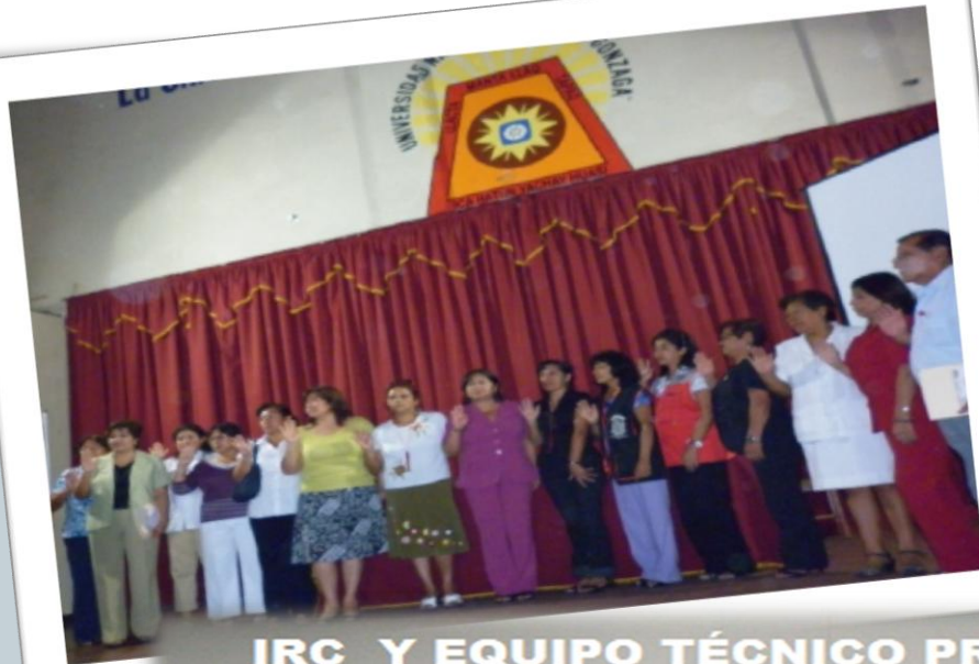
IRC Y EQUIPO TÉCNICO PRCVHM ICA 2012-2016