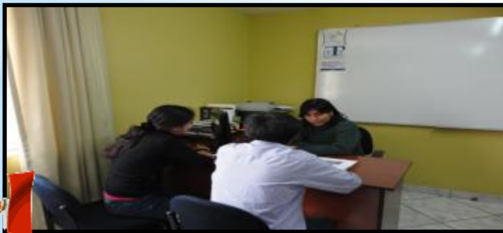
Atención a los usuarios