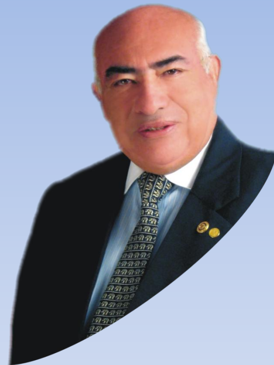
Rómulo Triveño Presidente Regional

Precisan criterios para delimitar proyectos de impacto regional. Provincial y distrital en el presupuesto participativo