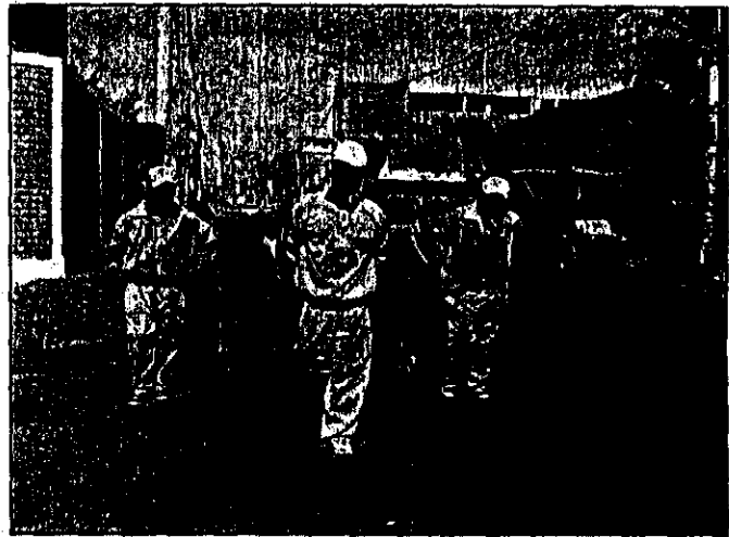
Obreros se quejan contra abusos de DIESTRA SAC

Es así que cerca de 300 obreros se constituirán el 31 de Julio a elegir a su nueva Junta Directiva, cuyos miembros tendrán que asumir el reto de velar por sus agremiados que enfrentan problemas con la concesionaria del servicio de limpieza DIESTRA SAC. Los obreros se quejan que la empresa les ha incrementado de 12 a 20 calles y que algunas veces el camión no ingresa a determinadas arterias, por lo que tienen que llevar corriendo los tachos de basura hasta el vehículo. Algunos obreros están